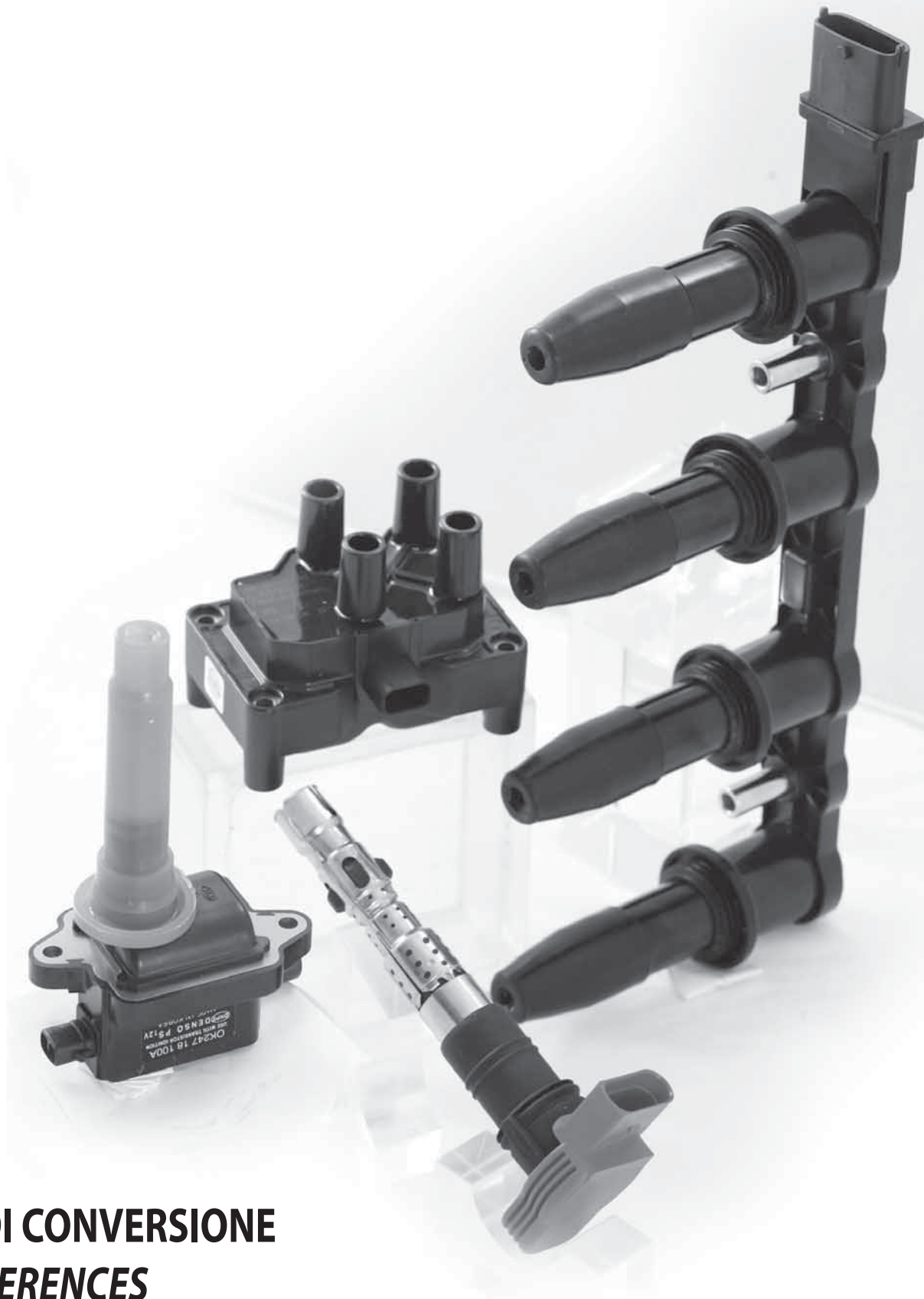
TABELLA DI CONVERSIONE CROSS REFERENCES