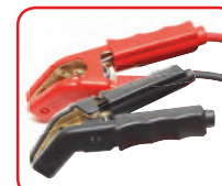
Cavi lunghi con pinze professionali / Long cables with professional clamps