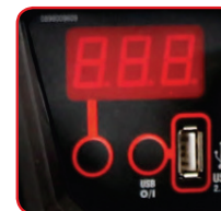
Digitale - Digital display USB output 2.1A

Equipaggiato con batteria ad alto spunto Premium AGM 23HD Equipped with high rate battery Premium AGM 23HD