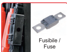
Fusibile / Fuse

Equipaggiato con batteria ad alto spunto Premium AGM 23HD Equipped with high rate battery Premium AGM 23HD